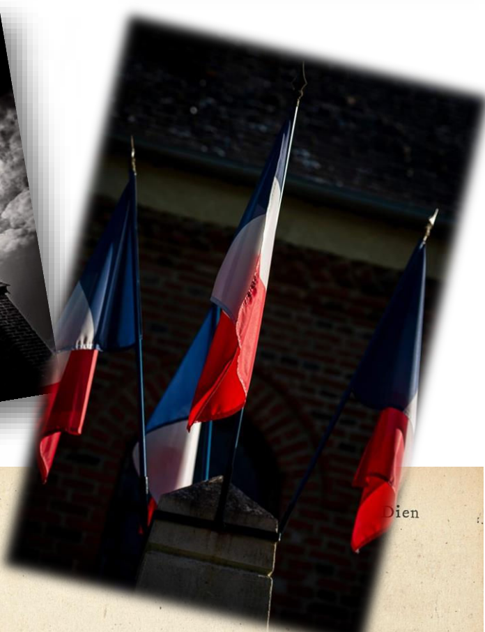
Mortefontaine-en-Thelle — Vue Générale